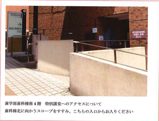
歯学部歯科棟南 4階 特別講堂へのアクセスについて 歯科棟北に向かうスロープをすすみ、こちらの入口からお入りください

懇親会場(事前申込制) 17:00~ 会場：あるめいだ (食堂棟 1階) ※階段を降りて下さい